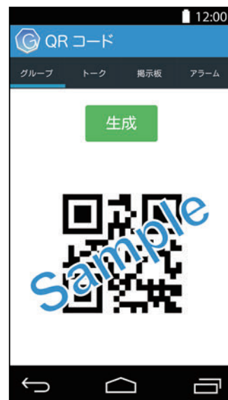
図5 QRコード表示画面