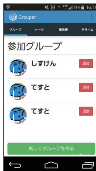
図6 参加グループ一覧画面