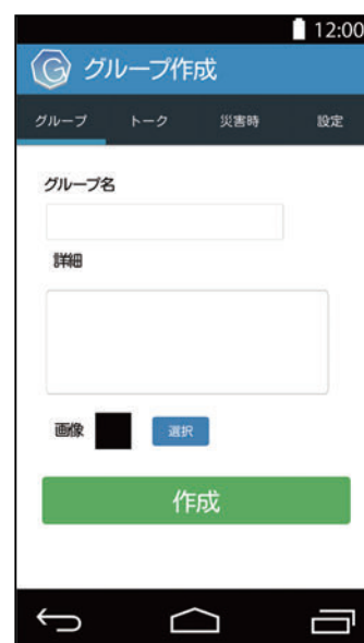
図4 グループ作成画面